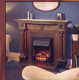
Портал Victoria, очаг Shaftsbury