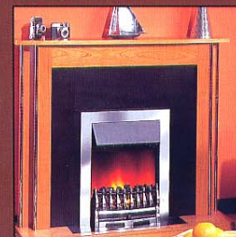
Портал Hamilton, очаг Wynford Chrome