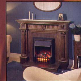
Портал Victoria, очаг Shaftsbury