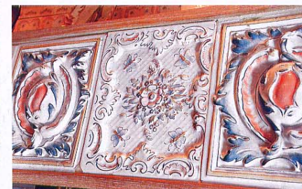
Рисунок с антикварных печных изразцов был в точности перенесен на керамическую поверхность плитки методом деколирования**. Снаружи трудно отличить оригиналы от имитации, но с тыльной стороны разница хорошо видна: современная плитка обычная, плоская, а старые образцы имеют объем (это делалось специально, чтобы печи дольше хранили тепло).

* Цельной планкой называют однополосную паркетную доску. Ее верхний слой представляет собой единую поверхность, покрывающую доску по всей длине и ширине.