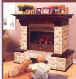
Портал Exter Lux, очаг Limoge