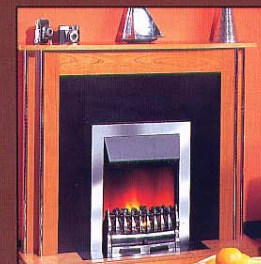
Портал Hamilton, очаг Wynford Chrome