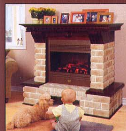
Портал Exter Lux, очаг Limoge